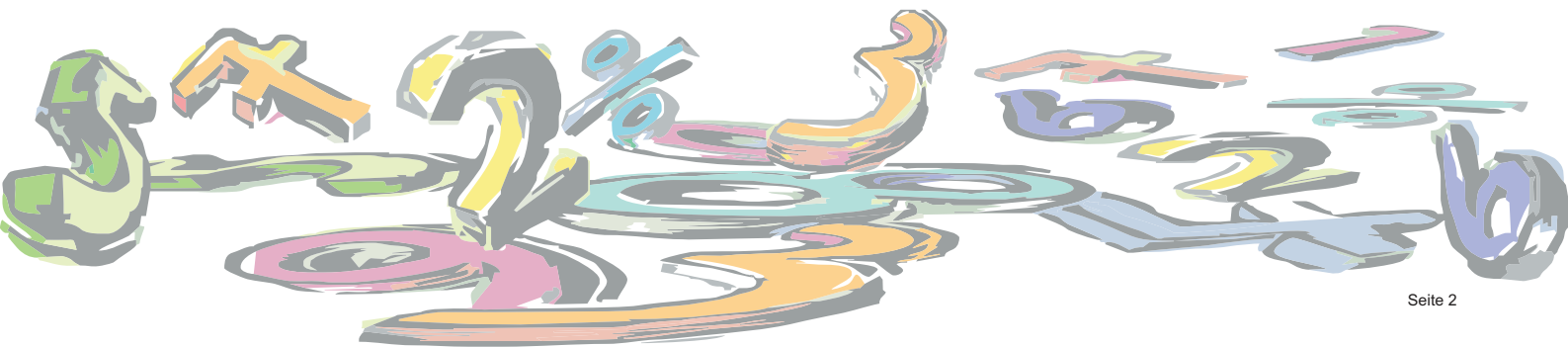
Christian Bussebaum Integrativer Dyskalkulietherapeut FH Kinder- und Jugendlichenpsychotherapeut